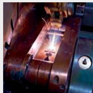
Лазерная сварка коллекторов