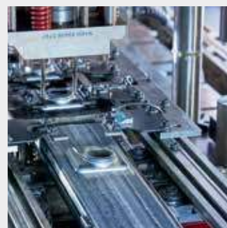
Точное изготовление половинок коллекторов