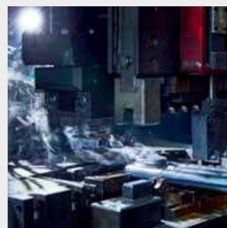
Сварка коллекторов с трубами